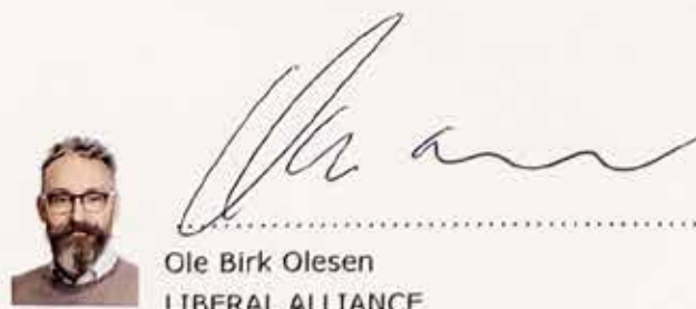
Ole Birk Olesen LIBERAL ALLIANCE