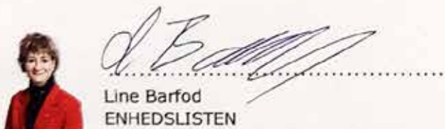
Line Barfod ENHEDSLISTEN